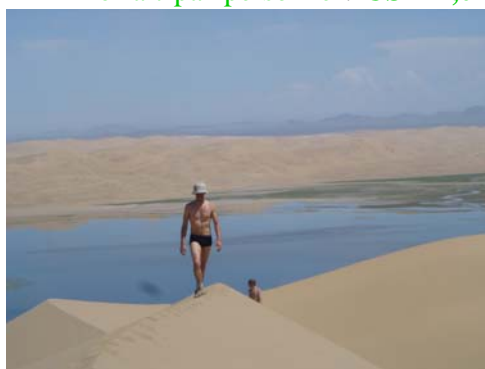
Lac Ereen et sand dunes