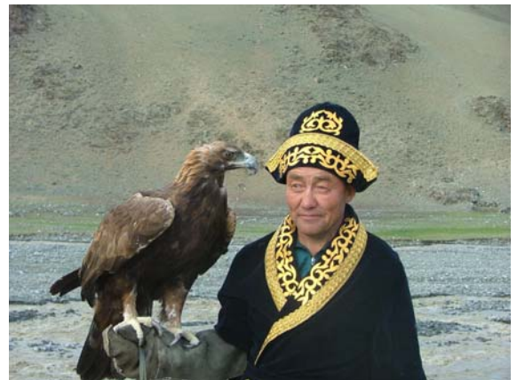
Chasseur de Kazakh avec son aigle

Sur la route vers Oulan-bator, passage par Elsen tasarkhai, harmonie de l'ensemble de tous types de paysage tels que les montagnes, du sable et la rivière. Visite du parc nationale de Hustai pour voir les chevaux sauvages Takhi-les seuls chevaux sauvages authentiques qu'on trouve sur Terre.