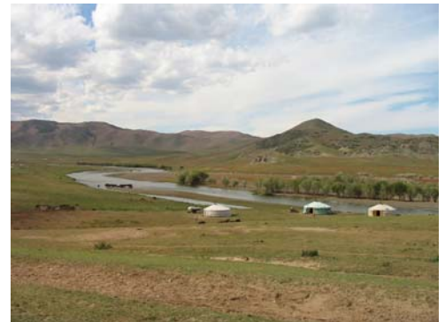
Vallee de riviere d'Orkhon

Vous descendrez dans le sud Gobi découvrir les steppes infinies et des roches au milieu de la steppe, les falaises flamboyantes de Bayanzag, célèbre pour ses oeufs de dinosaures et d'autres fossiles, le canyon glacé de Yolín Am où vous verrez des mouflons et bouquetins et des oiseaux. Gravier les dunes de Khongorin els, une des plus grandes dunes de Mongolie et y faire des ballades en chameau et découvrir la faune et flore du désert du Gobi.