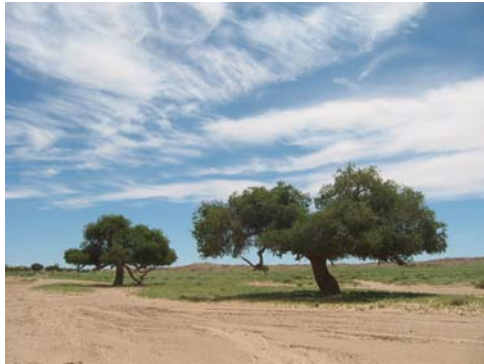
Saxaouls en Gobi

Remonter vers les montagnes boisées de l'Arkhangai, la région des 8 lacs (Naiman nuur) pour découvrir la pittoresque vallée de l'Orkhon, les chutes de la rivière Orkhon, le monastère Tovhön dominant les montagnes boisées de l'Arkhangai et visitez Kharkhorin- Ancienne capitale de L'Empire Mongol fondée par Genggis Khan et le monastère Erdenezü. Sur la route vers Oulanbator, passage par Elsen tasarkhai, harmonie de l'ensemble de tous types de paysage tels que les montagnes, du sable et la rivière. Visite du parc nationale de Hustai pour voir les chevaux sauvages Takhi.